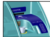
入れやすい金銭部